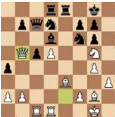
7. Schwarz am Zug