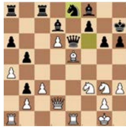
5. Weiß am Zug