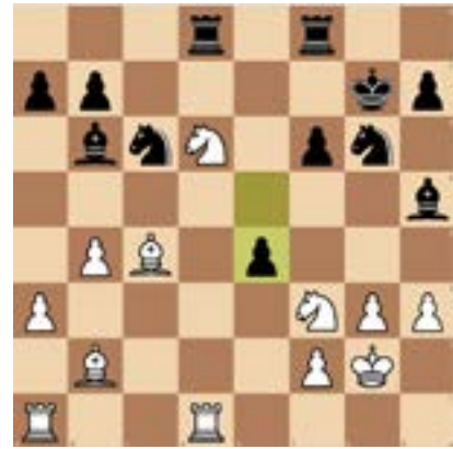
6. Weiß am Zug