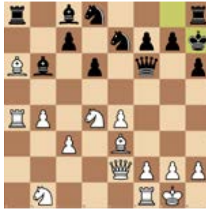
2. Weiß am Zug