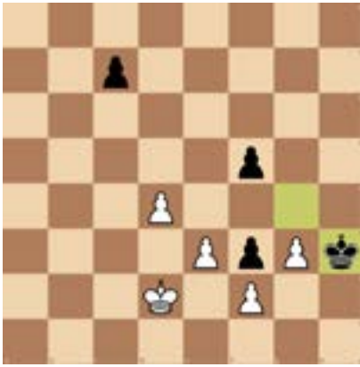
1. Weiß am Zug