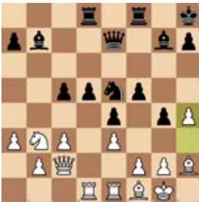
4. Schwarz am Zug