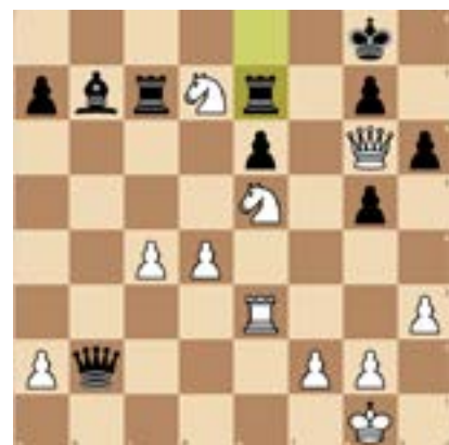
9. Weiß am Zug